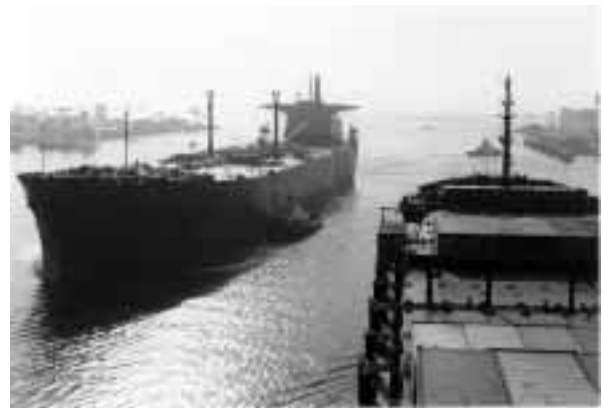
写真1 パイロットにきょう導され、 ロサンゼルス港を出港中のコンテナ船

米国のパイロット養成制度は日本のものとはかなり違うなと思いましたが、その当時は、パイロット養成制度は各国固有のもので、日本における「3,000G/T以上の船舶における3年以上の船長経験を有すること」というパイロットの資格要件は、簡単には変わらないだ