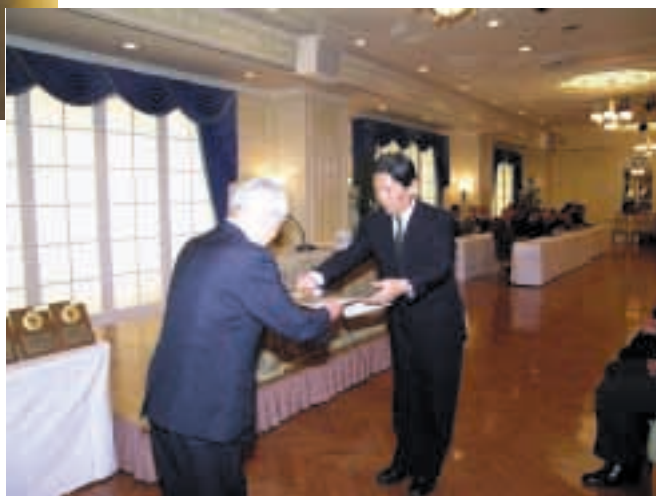
ベストクオリティシップ賞 2005 の表彰